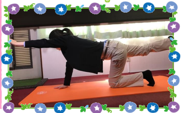
体幹を鍛えるポーズ