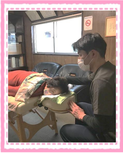
理学療法士 山田先生による施術 (地域住民の方)